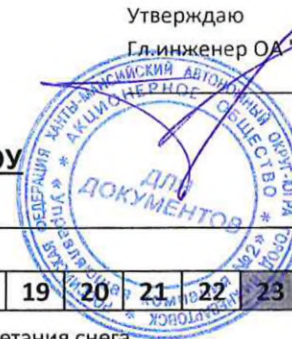
График очистки кровель от снега и наледи ЖЭУ